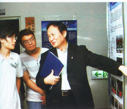
畢業展可以激發學生的潛力，作品也可作為以後開發的參考藍圖。