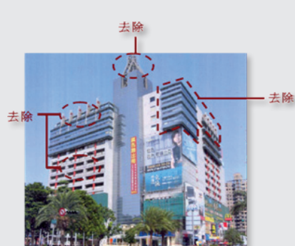
圖7 . 尊重自然的減量修繕方式