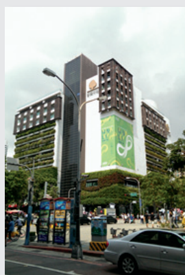
圖8. 全國聞名之觀光勝地之勤美誠品綠園道

其建築外牆的整建與維護方面：以大樹意象建設一個都市空間的立體花園，且為市民廣場的大背景，成為都市景觀連結的一環，大樹下的活動是與綠園道連接的，人們就穿梭在大樹下。南向植生牆面對市民廣場，人的活動就像在花園中遊走(圖 14)。建築