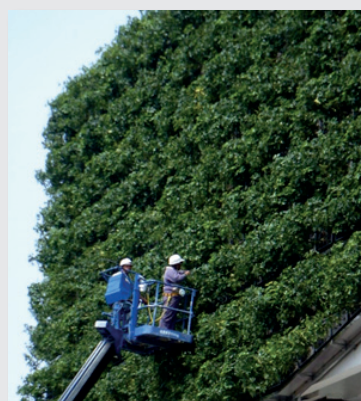
圖10. 每天製造150公斤健康鮮氧氣供養大自然