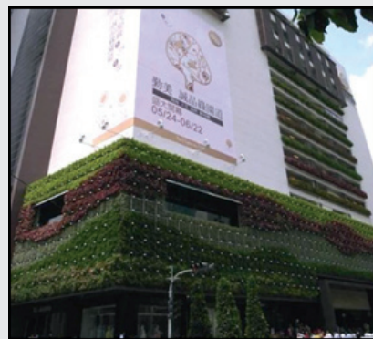
圖14. 南向植生牆面對市民廣場結合市民活動就像在花園中遊走