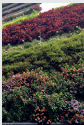
圖9. 勤美首創立體生態綠牆