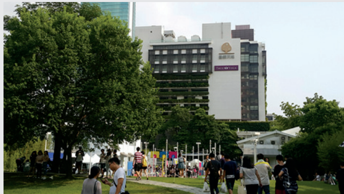
圖2. 市民活動融入勤美術館綠色空間