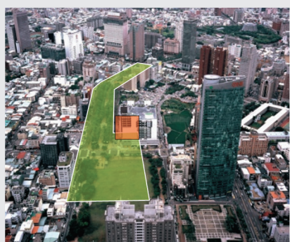
圖4 . 生態綠廊立體圖