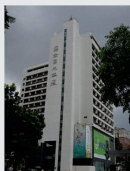
圖6 . 全國大飯店