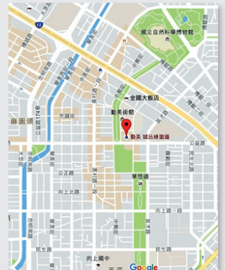
圖3. 生態綠廊平面圖