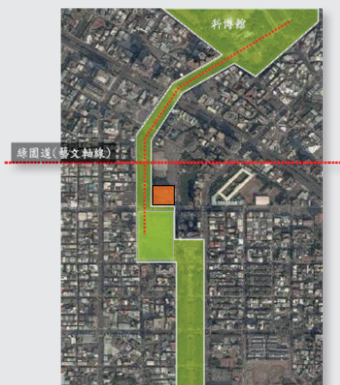
圖1. 藝文軸線綠帶系統連結都市各種不同土地分區活化使用