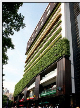
圖13. 建築下層人行活動空間設置大面積綠葉營造濃密林蔭意象