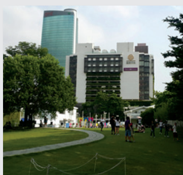
圖5 . 勤美術館