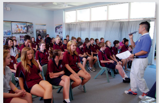
圖12. 慈青溫政翰與黃金海岸慈濟人，前往澳洲Ipswich高中分享『環保人生-愛地球』