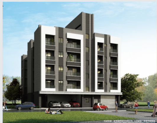
圖9. 威泰錢都8期3D外觀圖