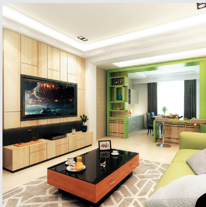
圖8. 套房樣品屋實景圖