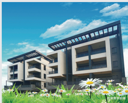
圖11. 墅JIA - 外觀實景圖