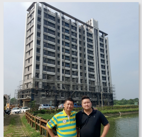
圖6. 父子用心經營打造好宅