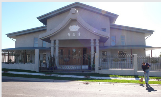
圖2. 澳洲黃金海岸靜思堂