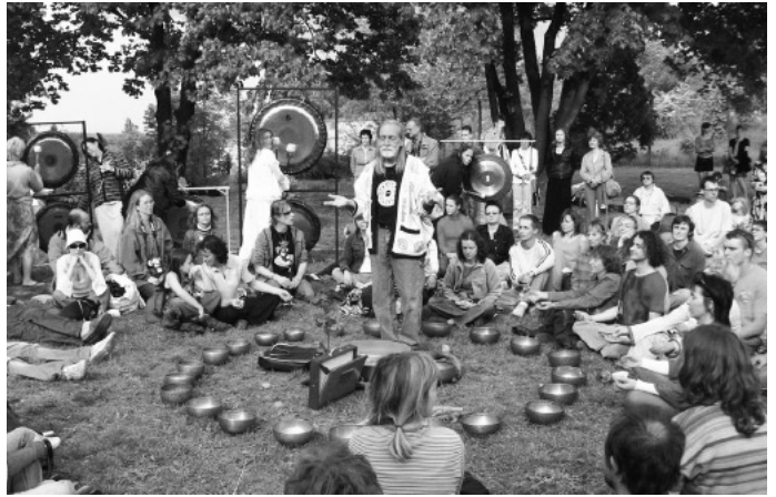
圖三. 世界和平銅鑼花園聯盟-案例