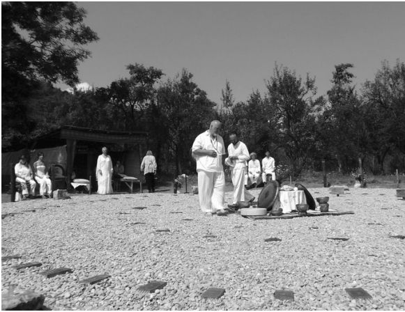
圖二. 世界和平銅鑼花園聯盟-案例