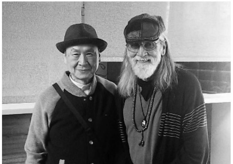
圖六. 康諾唐大師(右)與筆者互換帽子合影