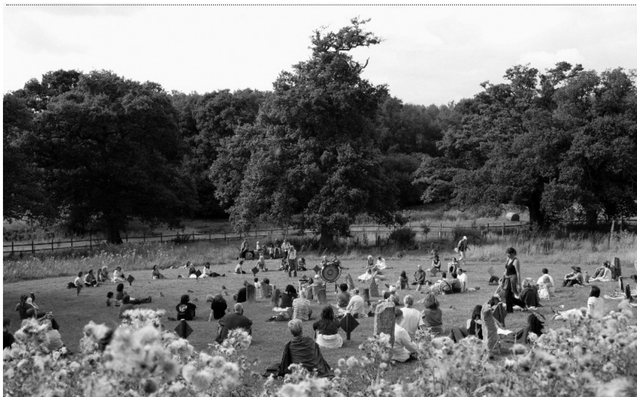
圖一. 世界和平銅鑼花園聯盟-案例

全世界各城市和平花園隨著康諾唐大師的年度全球巡演、神聖幾何銅鑼瑜珈、聲音療癒以及慶典表演藝術等，激發世界各國城市和平花園共振而形成同步意識，為世界和平祈願。康諾唐大師以歷史演化及深化體認，發覺世界上每個群體思維之差異性乃源自各自奉行使用各種本土的曆法(calendar)觀念及習俗有關，在煉金意義(alchemical sense)上說，真正的伊甸園即理想大同世界中各人類群體本是互相包容的，以愛為禮物彼此分享，因此我們提供了世界和平花園為禮物，彼此發散每個城市愛的關懷，互相和諧共振，每個和平花園性質上都會包含世界網絡會員中其他城市花園，形同第三諧音(tri tone)調解不同的干擾及差異之音波一般，共創禮運大同世界，慎重承諾留給下一代一個和平無汙染、無戰爭的世界。