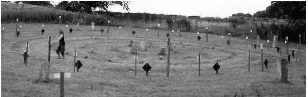
圖四. 世界和平銅鑼花園聯盟-案例